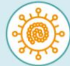
КІР, ПАРОТИТ, КРАСНУХА